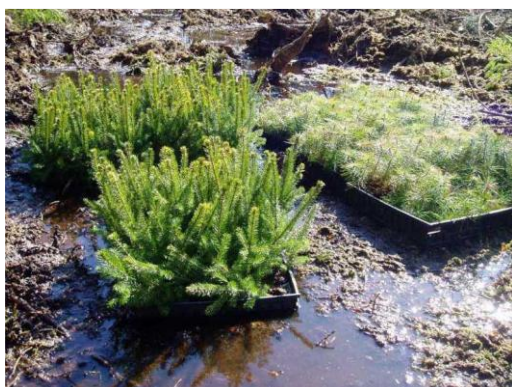
Joonis 2. Potitaimede vees hoidmine enne istutamist