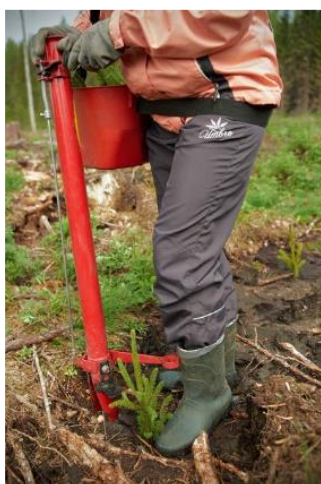
Joonis 1. Istutustoru

Enne istutamist tuleb potitaimi kõvasti kasta, et turbatuub oleks veest läbi imunud, nii et selle pigistamisel tilgub vett.